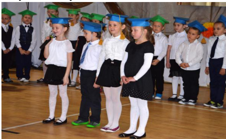
Pierwszaki prezentują program artystyczny